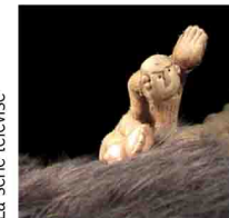
La série télévisé