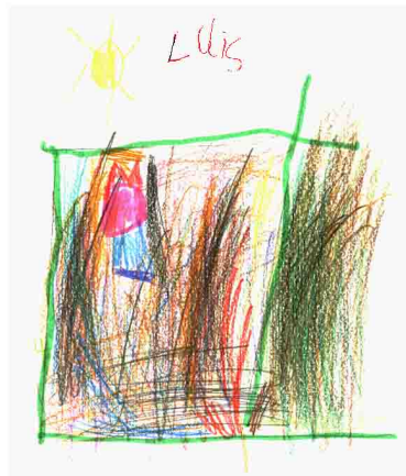
Les enfants de Tressan (34)